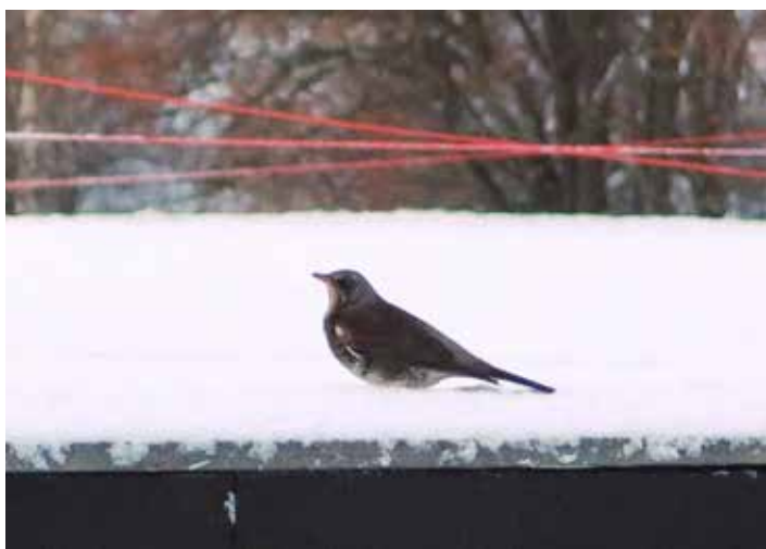
Gråtrost ( Turdus pilaris )

Det er ikke alle gråtroster som drar sydover om vinteren, noen liker seg på Bogstad hele året. I vinter har fuglen på bildet vært å se rundt klubbhuset.