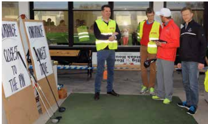
God stemning på brukmarkedet i 2014 hvor det var aktiviteter for både store og små.

når store arrangement skal avvikles. Bruktmarkedet er intet unntak. Skal det bli et hyggelig og effektivt arrangement trenger klubben innsats fra flere frivillige til å utføre alt fra loddsalg og vaffelsteking til prising, salg og utlevering av utstyr. Martin, oppfordrer derfor alle som har lyst til å ta i et tak for klubben om å melde sin interesse ved å sende en e-post til mardaun@upa.no.