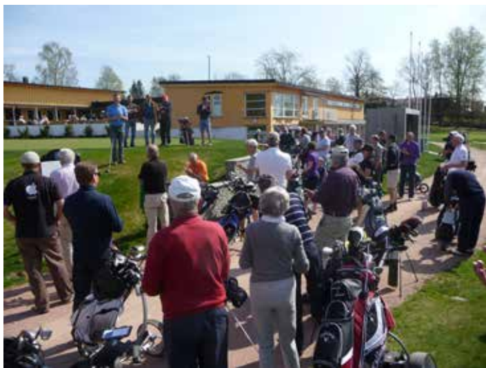
Styreleder sier noen velvalgte ord før dugnadsturneringen startet den 26. april i fjor.

Vi krysser fingene og håper på en «snill» vår og at været blir like bra som under dugnaden i 2014.